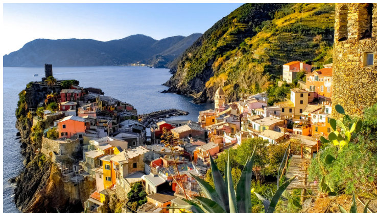
Page 1 de 5 - Copyright Europe Active - 2 Mai 2026

Environ 13kms et 5H30 de marche. +600m, -600m.